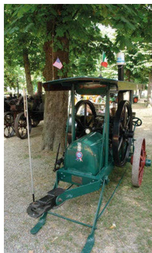
■ Locomobile Enrico Boldrini con motore a testa calda Mietz-Weiss dei primi del '900.

Oltre alla mostra dei trattori, sono state organizzate escursioni e nel pomeriggio di sabato 13 presso la Sala del Consiglio Comunale si è tenuto un convegno dal titolo "L'aratura di Stato. I trattori agricoli prelati nella Prima Guerra e poi riconvertiti all'agricoltura", seguito da proposte e normative relative all'ambiente, alla preservazione e circolazione degli storici e da un intervento sulla carta Asi di storicità da parte del presidente dell'Asi Mino Faralli . ■