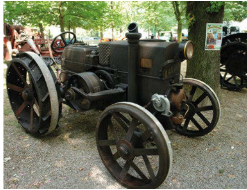
■ Landini 25/30 HP (del 1928) e, a destra, locomobile 12-14 HP (degli anni '20).