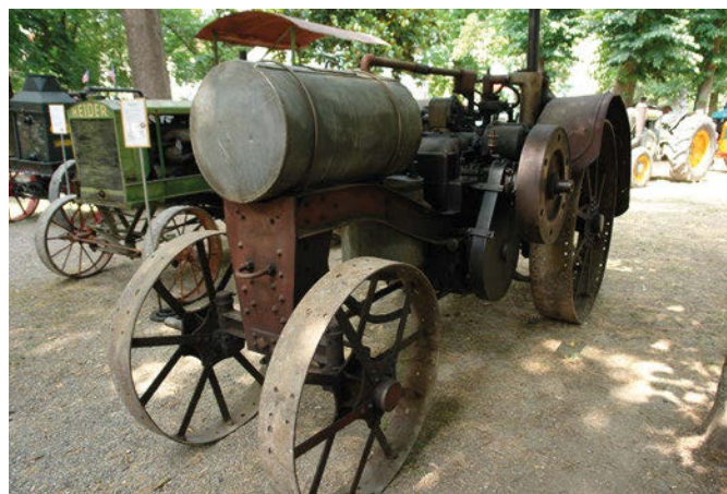
■ Titan 10-20, risalente al periodo 1916-1922.