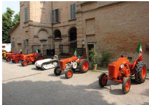
■ Collezioni parziali di trattori Oto Melara (a sinistra) e Rossi&Raimondi.