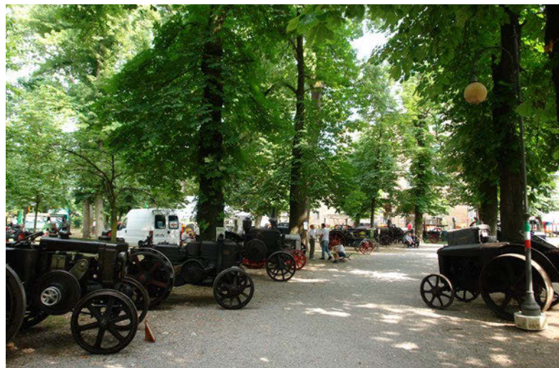
■ Una veduta del Parco Rocca di Castelnuovo di Sotto dove si è svolto l'Asi Tractors Show del 2015.

Parco Rocca del comune reggiano, provenienti da tutta Italia, hanno partecipato a questo affascinante raduno italiano, capace di mostrare ad appassionati e semplici curiosi i veicoli che hanno fatto la storia del mondo rurale.