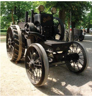
■ Trattore testacalda Bubba UTC 4.